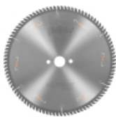
Пилы ALUEX +5° для резки алюминевых профилей и ПВХ