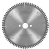
Пилы ALUEX -5° для резки алюминевых профилей и ПВХ