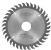
Пилы ALUEX -Grooving- для обработки канавок и фрезерования AL, цветных металлов, ПВХ