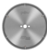
Пилы ALUEX MARATHON 1GA-5° для резки алюминиевых, цветных металлов и ПВХ