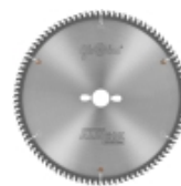
Пилы ALUEX MARATHON 1GA+5° для резки алюминиевых, цветных металлов и ПВХ