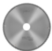
Пилы SEALUEX WB+15° для резки профилей из ПВХ с резиновой прокладкой