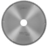
Пилы SEALUEX WB+15° для резки профилей из ПВХ с резиновой прокладкой