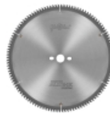
Пилы ALUEX MARATHON 1GA-5° для резки алюминиевых, цветных металлов и ПВХ