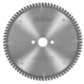
Пилы ALUEX -5° для резки алюминевых профилей и ПВХ