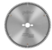
Пилы ALUEX MARATHON 1GA+5° для резки алюминиевых, цветных металлов и ПВХ